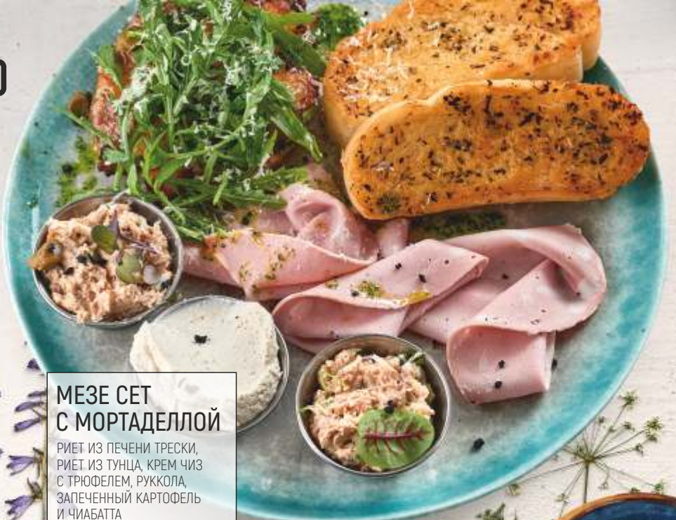
МЕЗЕ СЕТ С МОРТАДЕЛЛОЙ РИЕТ ИЗ ПЕЧЕНИ ТРЕСКИ, РИЕТ ИЗ ТУНЦА, КРЕМ ЧИЗ С ТРЮФЕЛЕМ, РУККОЛА, ЗАПЕЧЕННЫЙ КАРТОФЕЛЬ И ЧИАБАТТА 380 g 840