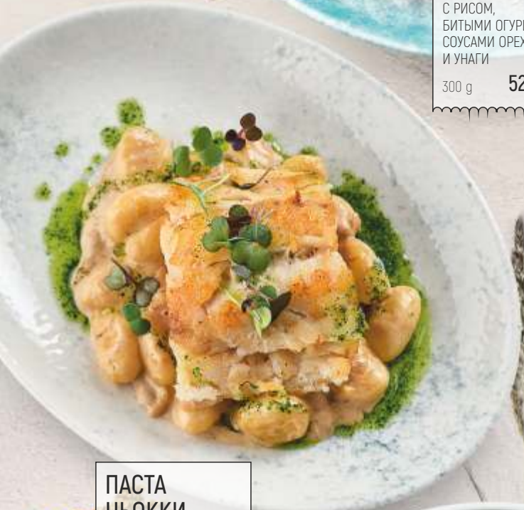
ПАСТА НЬОККИ С БЕЛЫМИ ГРИБАМИ И ТРЕСКОЙ 280 g 630