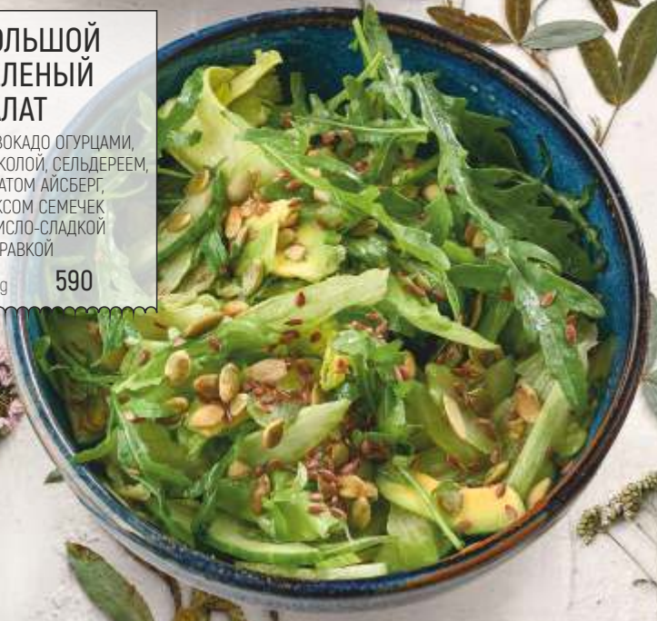
БОЛЬШОЙ ЗЕЛЕНЬИЙ САЛАТ С АВОКАДО ОГУРЦАМИ, РУККОЛОЙ, СЕЛЬДЕРЕЕМ, САЛАТОМ АЙСБЕРГ, МИКСОМ СЕМЕЧЕК И КИСЛО-СЛАДКОЙ ЗАПРАВКОЙ 230 g 590