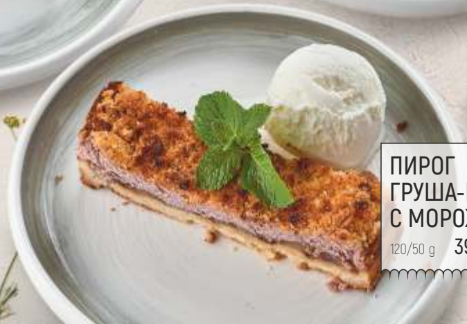
ПИРОГ ГРУША-МАЛИНА С МОРОЖЕНЫМ 120/50 g 390