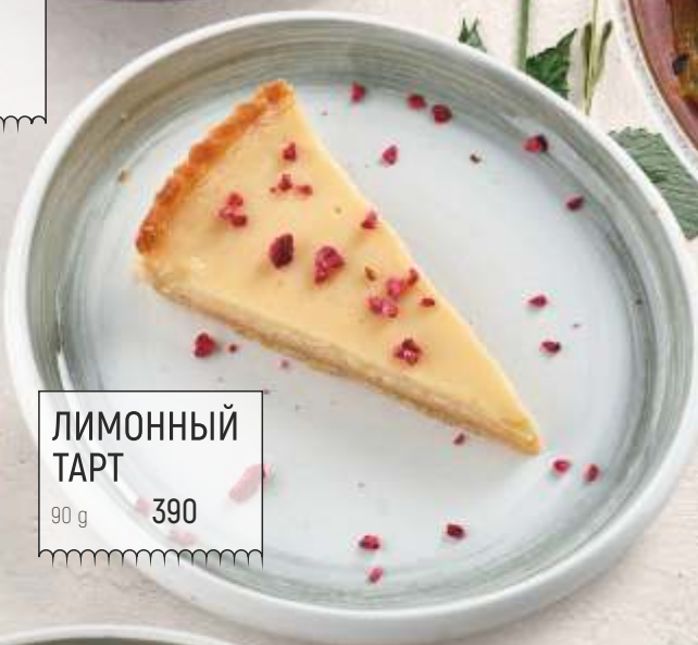
ЛИМОННЫЙ ТАРТ 90 g 390