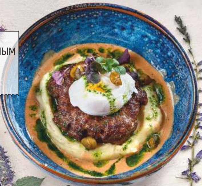
БИФШТЕКС С ТРЮФЕЛЬНЫМ ПЮРЕ И ПАШОТ 320 g 630