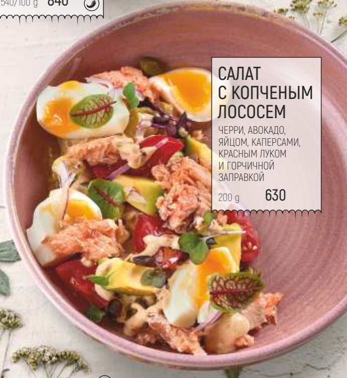
САЛАТ С КОПЧЕНЫМ ЛОСОСЕМ ЧЕРРИ, АВОКАДО, ЯЙЦОМ, КАПЕРСАМИ, КРАСНЫМ ЛУКОМ И ГОРЧИЧНОЙ ЗАПРАВКОЙ 200 g 630