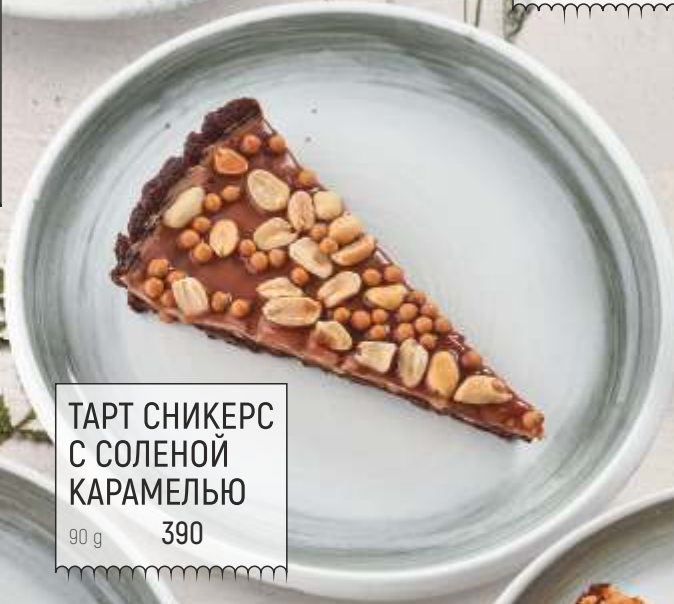
ТАРТ СНИКЕРС С СОЛЕНОЙ КАРАМЕЛЬЮ 90 g 390