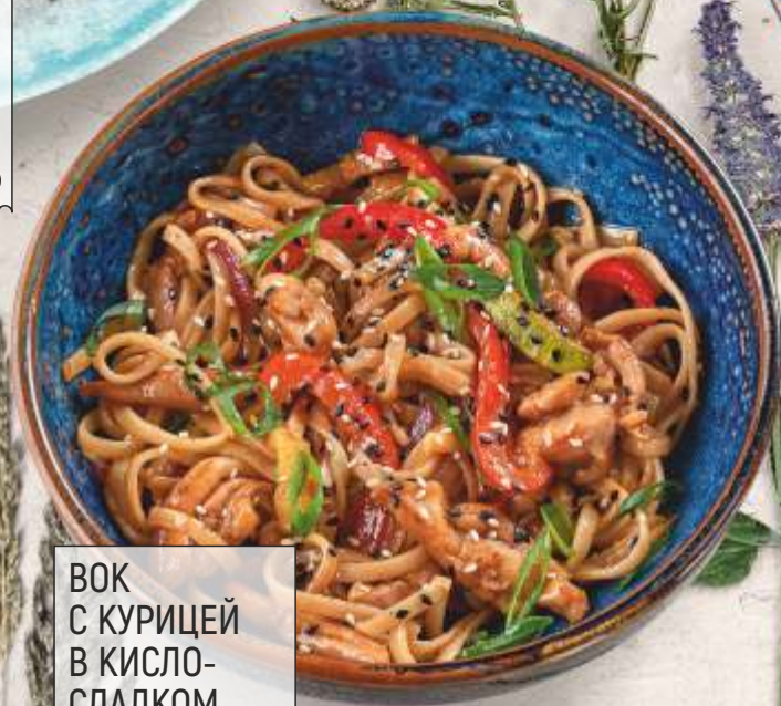
ВОК С КУРИЦЕЙ В КИСЛО- СЛАДКОМ СОУСЕ 300 g 520