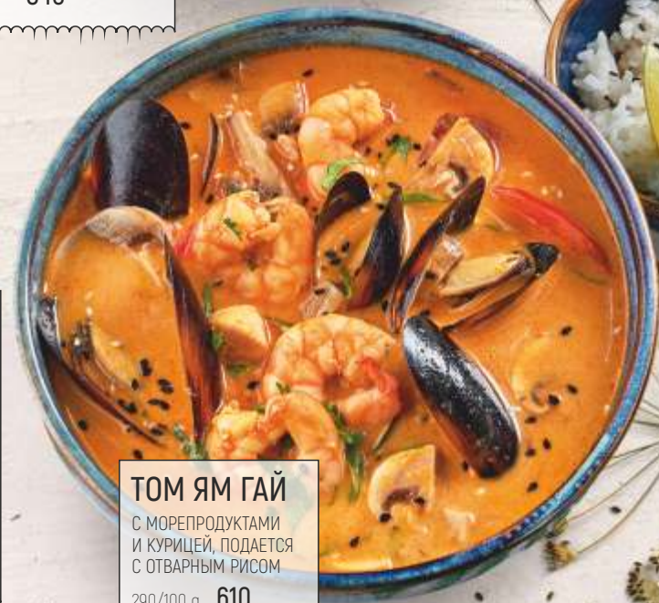
ТОМ ЯМ ГАЙ С МОРЕПРОДУКТАМИ И КУРИЦЕЙ, ПОДАЕТСЯ С ОТВАРНЫМ РИСОМ 290/100 g 610 540/100 g 840