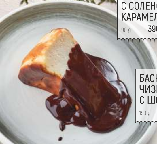
БАСКСКИЙ ЧИЗКЕЙК С ШОКОЛАДОМ 150 g 390