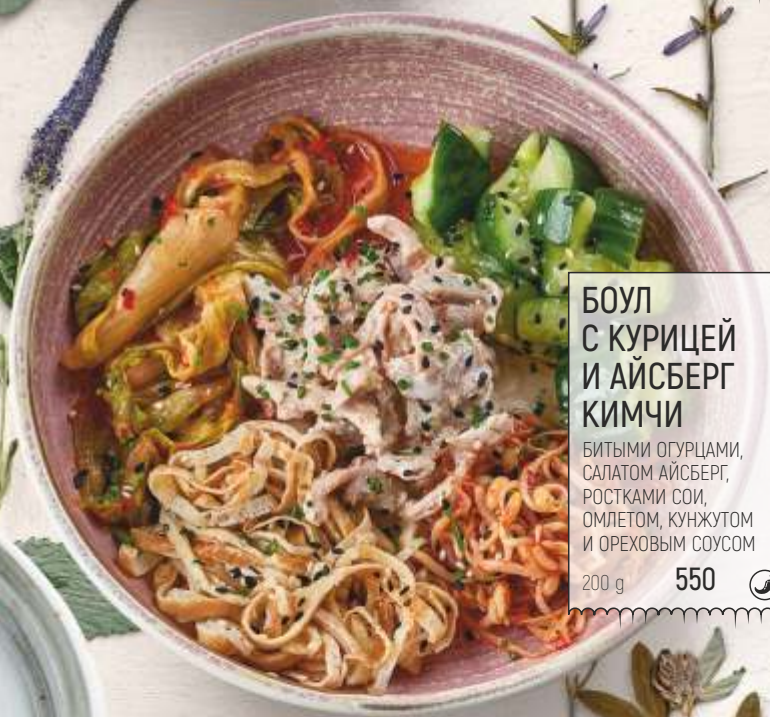
БОУЛ С КУРИЦЕЙ И АЙСБЕРГ КИМЧИ БИТЫМИ ОГУРЦАМИ, САЛАТОМ АЙСБЕРГ, РОСТКАМИ СОИ, ОМЛЕТОМ, КУНЖУТОМ И ОРЕХОВЫМ СОУСОМ 200 g 550